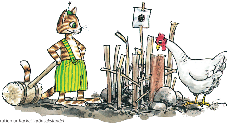
Illustration ur Kackel i grönsakslandet

Jag tror att många barn gillar Findus och gärna skulle vilja vara med honom på Pettsons gård. Jag tror att förhållandet mellan Pettson och Findus kan vara idealiskt för ett barn. En snäll vuxen som alltid finns till hands och vill vara med honom för det mesta, ett fritt liv nära naturen där han kan göra lite som han vill. Trygghet i en liten begriplig värld. Möjligen kan han sakna en bättre lekkamrat än hönorna, som inte är så sluga.