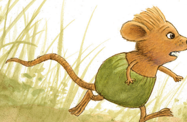
Illustration ur Var är min syster?

Roligast är de stora, fantasifulla bilderna som finns i t.ex. Var är min syster .