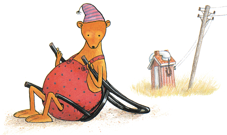
Illustration ur Nasse hittar en stol

Det är nog Pettson och Findus. För att jag känner mig mest hemma med dem. Men Nasse blev ju bra också.