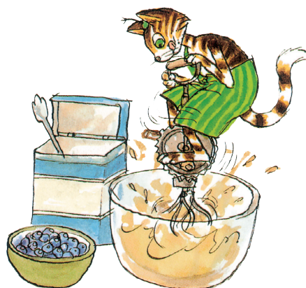
Illustration ur Pannkakstårtan

Den här intervjun är gjord med Sven Nordqvist inför hans 80 årsdag. Ett sätt att hedra honom och hans många böcker som ligger oss varmt om hjärtat.