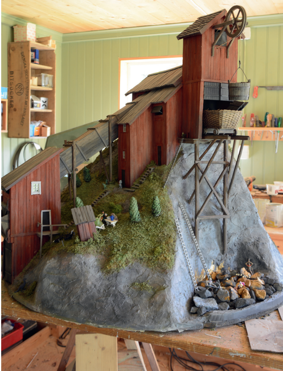
Modell till tågbanan i Barnens Bruk på Lövstabruks herrgård

Den här intervjun är gjord med Sven Nordqvist inför hans 80 årsdag. Ett sätt att hedra honom och hans många böcker som ligger oss varmt om hjärtat.