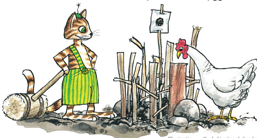
Illustration ur Kackel i grönsakslandet

Löser korsord, läser, ser på TV, ofta dokumentärer och filmer, tar promenader, går på gallerier och konstmuseer, spelar datorspel. På sommaren har jag en snickarverkstad där jag tycker om att bygga och snickra.