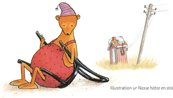
Illustration ur Nasse hittar en stol

Det är nog Pettson och Findus. För att jag känner mig mest hemma med dem. Men Nasse blev ju bra också.